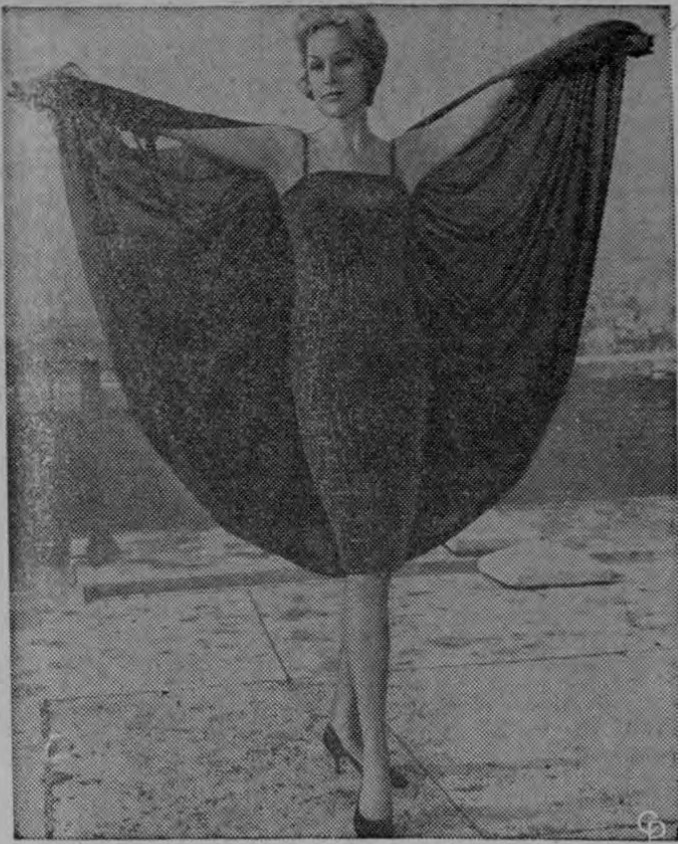
MODA ITALIANA. — Este atractivo modelo, creación de los modistas italianos, es ideal para lucir en ocasiones especiales. La capa confeccionada en gasa color violeta se sujeta en los hombros y da un toque de elegancia al modelo. Para completar se usan joyas que dan más realce al vestido.